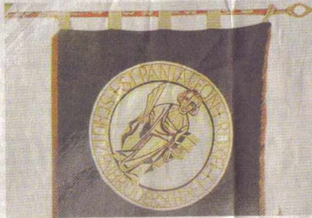
Die Veranstaltung am heutigen Samstag ist zugleich das Stiftungsfest zu Ehren der berühmten Dichterin Annette von Droste Hülshoff.

Das nächste Highlight steht um etwa 23 Uhr mit dem Auftritt der schwungvollen und fröhlichen Roxeler Funken auf dem Programm. Weitere unterhaltsame Tanzserien lassen den Abend für alle Schützenbrüder und Gäste vergnüglich ausklingen.